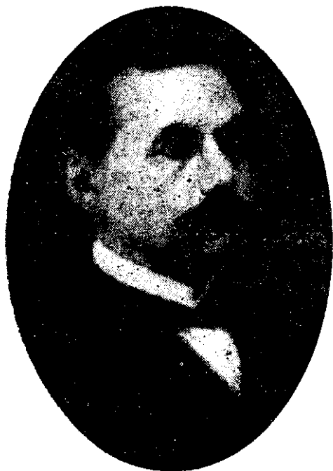
Dr. Justo Arosemena.

solidaridad hispanoamericana. Solo así, según las propias palabras de Justo Arosemena podríamos «tener asegurado nuestra doctrina de Bolívar, por oposición a la de Monroe, que no es sino el egoísmo de los anglo-americanos erigido en principio alucinador pero falaz». (41)