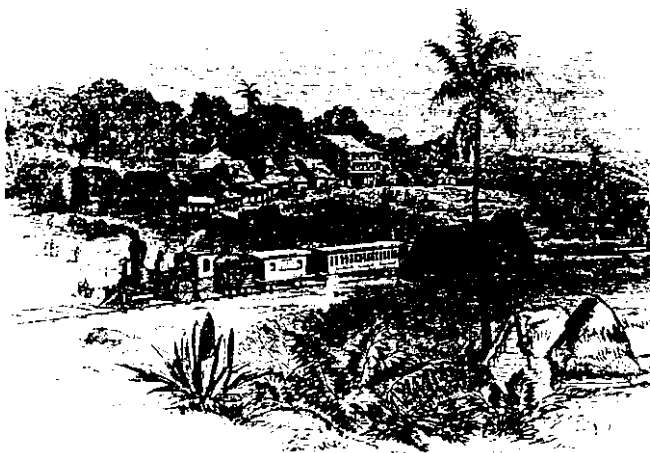
CRUZANDO EL ISTMO EN EL TREN

ridad, y preparar expediciones filibusteras que han estado a punto de lanzarse también sobre Panamá» (25)