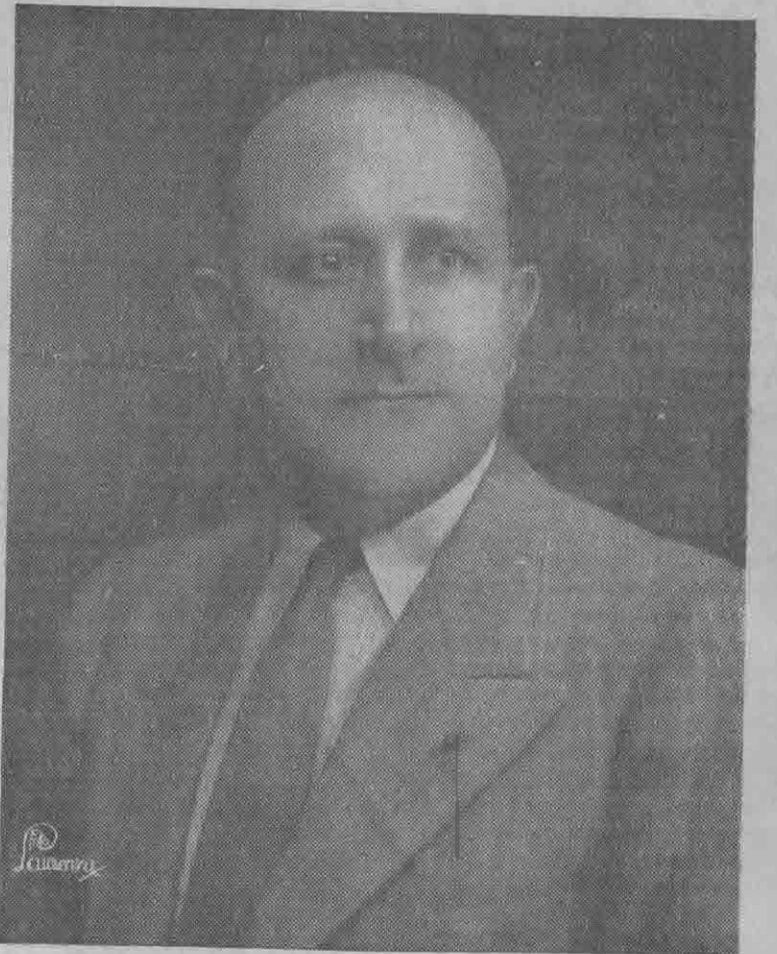
Don CARLOS J. QUINTERO, Gobernador de la Provincia de Colón, quien ha hecho para la ciudadanía colonense por conducto de su vocero más autorizado — CALLE 6 — las importantes declaraciones sobre la actual emergencia que con gusto pu blicamos en esta edición y las cuales constituyen un llamado a la cooperación general, que no debe ser desoído.