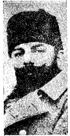
Mustafá Kemal, el que ha toreado mejor a los Miuras del imperialismo

Es decir, no, no se va a armar nada; no se puede armar nada: tranquilizaos; no recordaba yo que ahí está, velando amorosa por la paz del mundo, la angelical, la inefable Liga de Naciones.