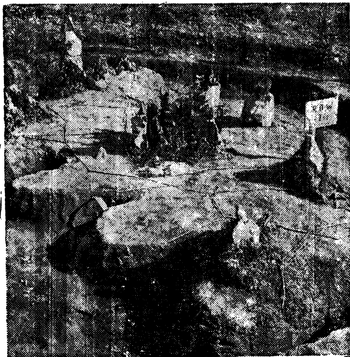
La foto nos muestra un mapa en relieve construido por prisioneros convalecientes en un campamento de Pusan. Este mapa presenta los Ferrocarriles, Caminos y Líneas de Transporte en Corea.