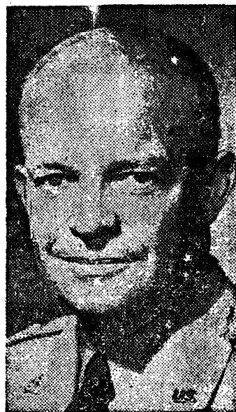
DWIGHT D. EISENHOWER

Quien asumirá el mando supremo de los E. E. U. U. el 20 de los corrientes y de quien se espera continúe la política del buen vecino.