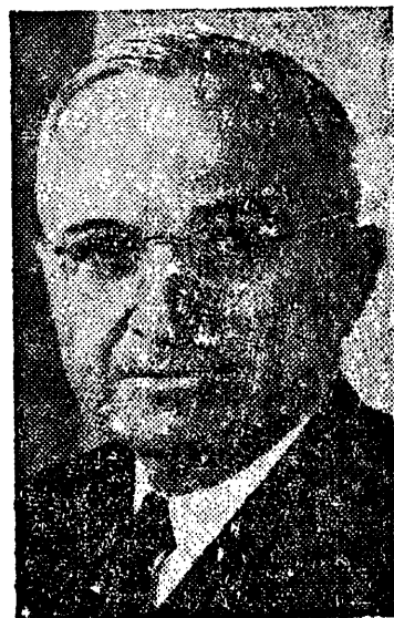
HARRY S. TRUMAN

Quien asumirá el mando supremo de los E. E. U. U. el 20 de los corrientes y de quien se espera continúe la política del buen vecino.