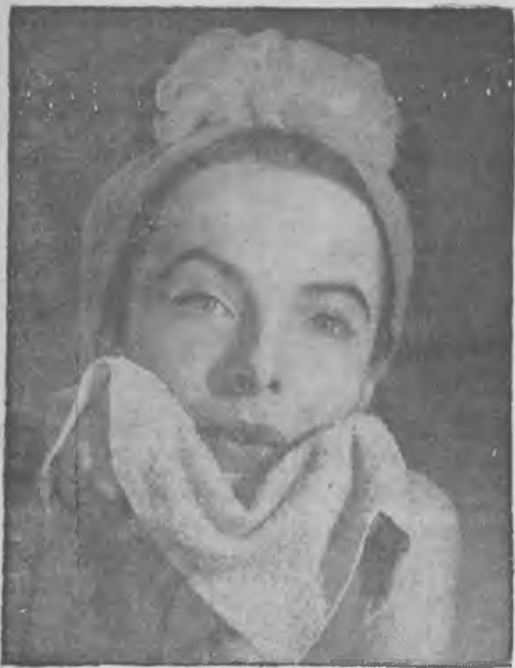
Este tratamiento es especial para el cutis.