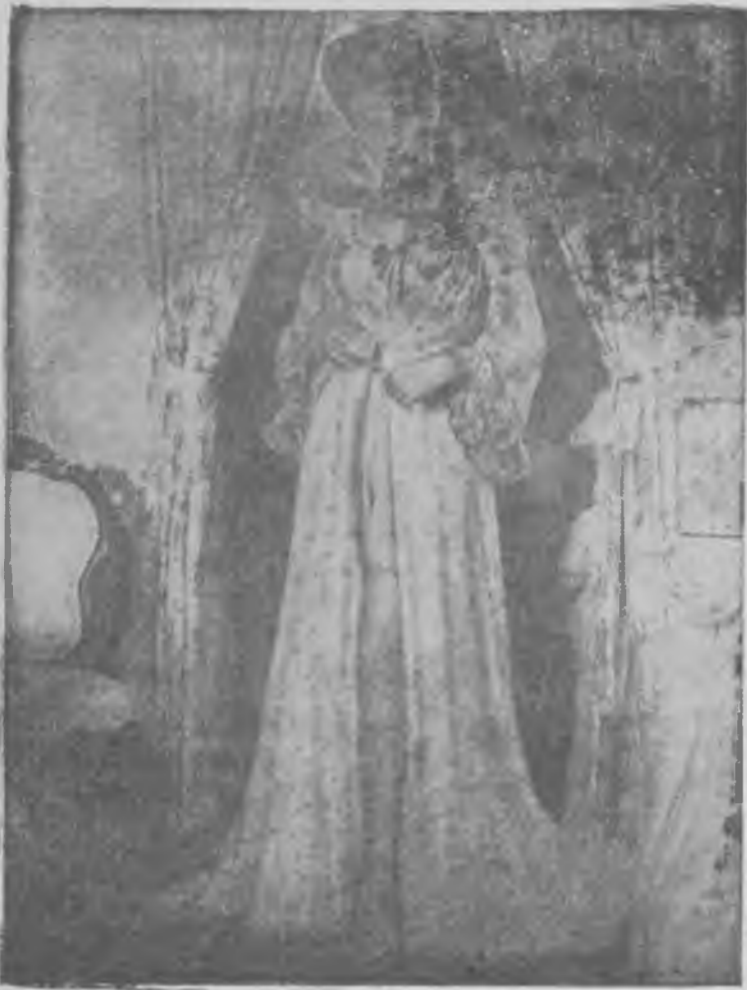
Virginia Mayo lleva siempre atavíos femeninos al desayuno.