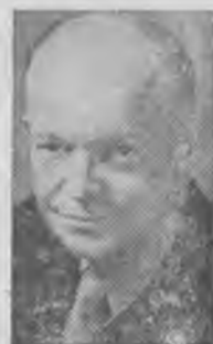
El General Eisenhower

El propio general agregó que "en tanto que la indigencia, los prejuicios y los sentimientos de injusticia perduren en el mundo, ningún país podrá sentirse libre de temor, especialmente en la época actual en que esta verdad se ha hecho más evidente como consecuencia de los nuevos inventos de armas terribles y aterradoras de tan concentrada potencia destructora. . . . El futuro resplandeciente de paz, de confianza mutua y de libertad que vislumbramos para los que habitan dentro de nuestras fronteras, jamás lo contemplaremos hasta tanto que los demás pueblos del mundo puedan alcanzar, hasta donde les sea posible, la realización de propósitos semejantes."