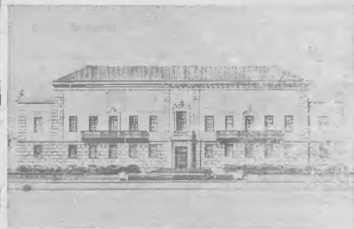
Dibujo del nuevo edificio que se propone construir la Unión Panamericana en Washington.

WASHINGTON.—Tan pronto como lo permita la situación actual, la Unión Panamericana procederá a construir un anexo a su hermoso palacio con el fin de aliviar la conglomración de empleados que trabajan en sus oficinas.