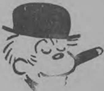
EL POPULAR BOZO