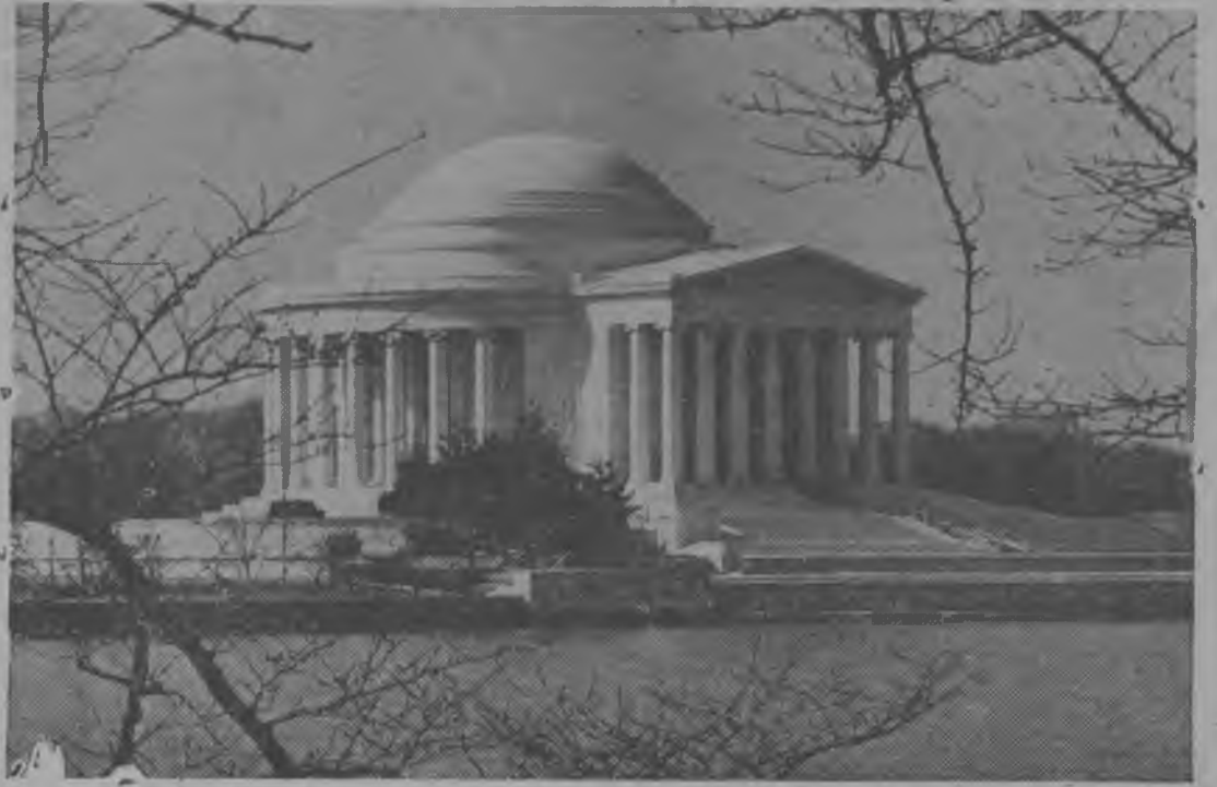
Monumento a Jefferson en Washington, D. C. Este monumento de mármol blanco en memoria de Thomas Jefferson, autor de la Declaración de Independencia y tercer Presidente de los Estados Unidos, erigido en Tidal Basin en el Parque Potomac, fué dictado por el Presidente Roosevelt el 13 de Abril de 1943, en el 200 aniversario del nacimiento de Jefferson.