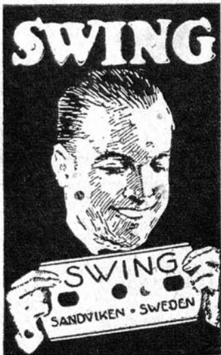
DE ACERO SUECO AL CARBONO