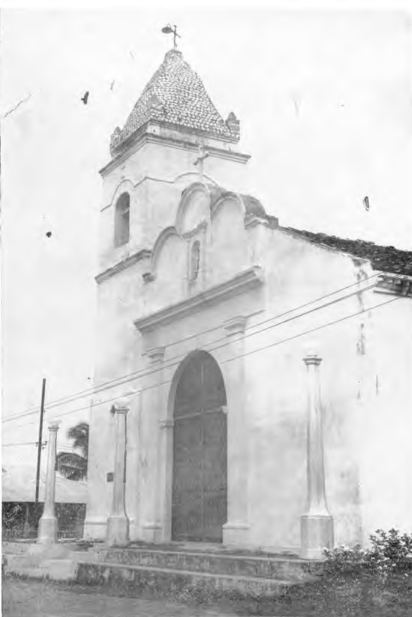
“...la iglesia del lugar, cuidada y protegida por el sencillo fervor religioso de los habitantes...”

Cabe hacer notar que durante los últimos años San Carlos tiende a crecer nuevamente, no con ritmo vertiginoso ni mucho menos, pero sí lo suficiente para vaticinar que en el censo de mil novecientos sesenta su población será un poco más elevada.