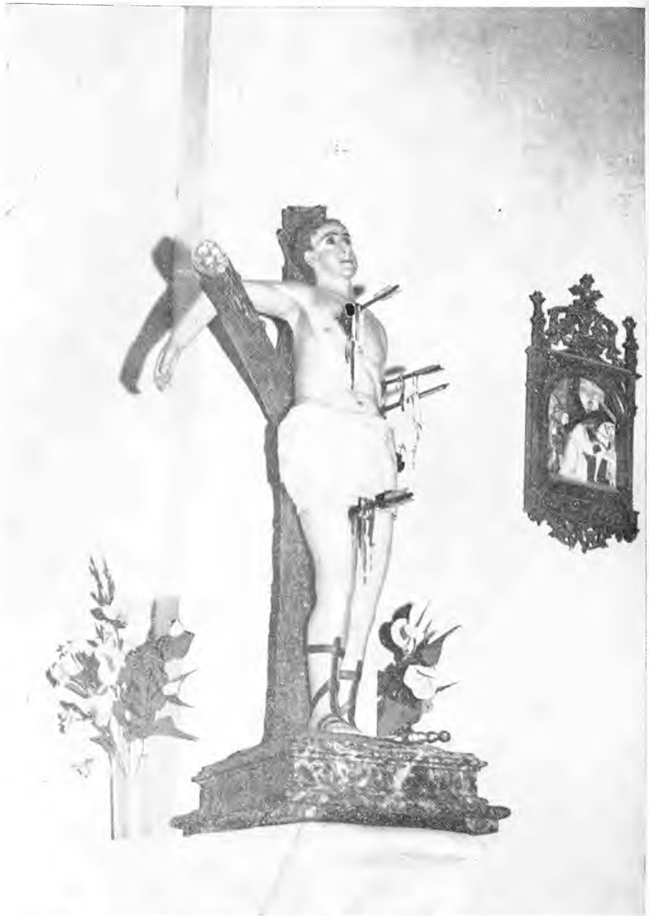
"... rinden culto a las imágenes de los santos, a las cuales solicitan ayuda y protección en cualquier conflicto..."

Casi todos los días, pero sobre todo los fines de semana, llegan a San Carlos carros cargados de capitalinos, zoneítas, que van en busca del refugio maravilloso de sus playas. Y en ellas pasan horas y horas, sin cansarse y sin aburrirse, porque es eterno el encanto de esos lugares, bañados por el sol y acaricia-