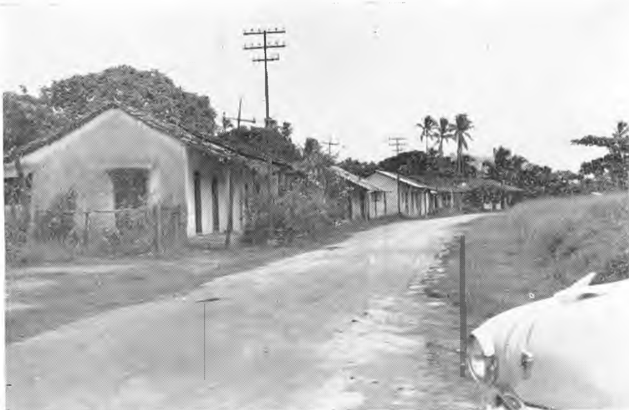
"... las calles limpias, de brillantes arenas, orilladas por los jardines de las residencias, que asoman sus anchos portales..."

No lejos de una mar que el viento riza y a veces enfurece; cerca a un río que manso se desliza