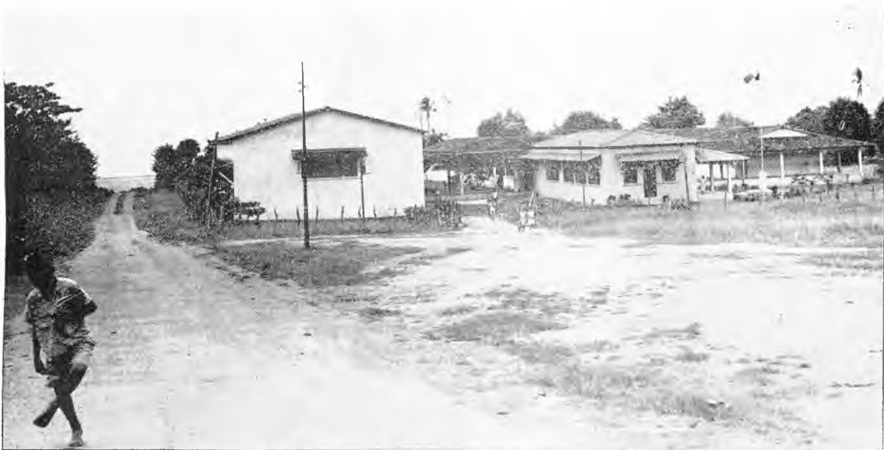
"... los modernos edificios de la escuela primaria, que están cerca de la playa, acariciados por los vientos marinos..."

Por ello, y teniendo en cuenta su magnífica situación, las ventajas que le ofrece la cercanía del mar, y la fertilidad de la tierra, es fácil predecir que el pueblo sancarleño no desmayará en la batalla por su mejoramiento y continuará luchando con el mismo espíritu público por alcanzar más elevados niveles de vida para sus habitantes.