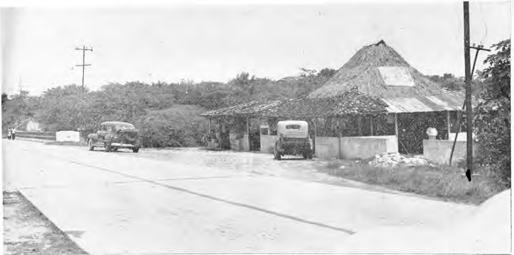
"...se ha convertido en obligado punto de descanso para centenares de vehículos que viajan por la carretera central..."