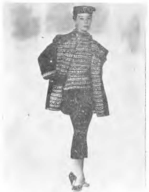
De Lola Prusac es este modelo bautizado "Via Láctea", que es un conjunto en "cheviote" grueso, negro: el interior de la casaca y la parte alta del traje, de "tweed" negro y blanco bordado en lana.

Otra creación de Lola Prusac: se llama "Espiral". La falda en "tweed" negro y ocre, bordada con un galón negro en espiral, de la misma tela. "Echarpe" también en "tweed" negro y ocre. La blusa en jersey negro, mangas largas y cuello alto. Para ir de compras.