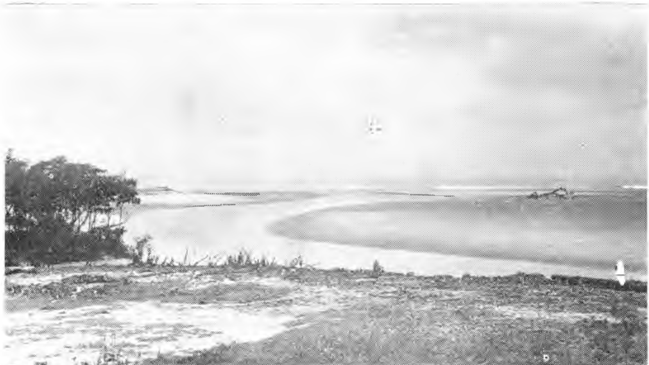
"... las playas se extienden por millas y millas, con sus blancas arenas acariciadas por las crestas espumosas de las olas..."

Pese a su aparente molición, San Carlos siente hondamente los problemas comunales y se esfuerza constantemente por avanzar por los caminos del progreso material y espiritual. La Escuela del lugar, que