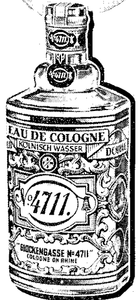
ETIQUETA AZUL Y ORO