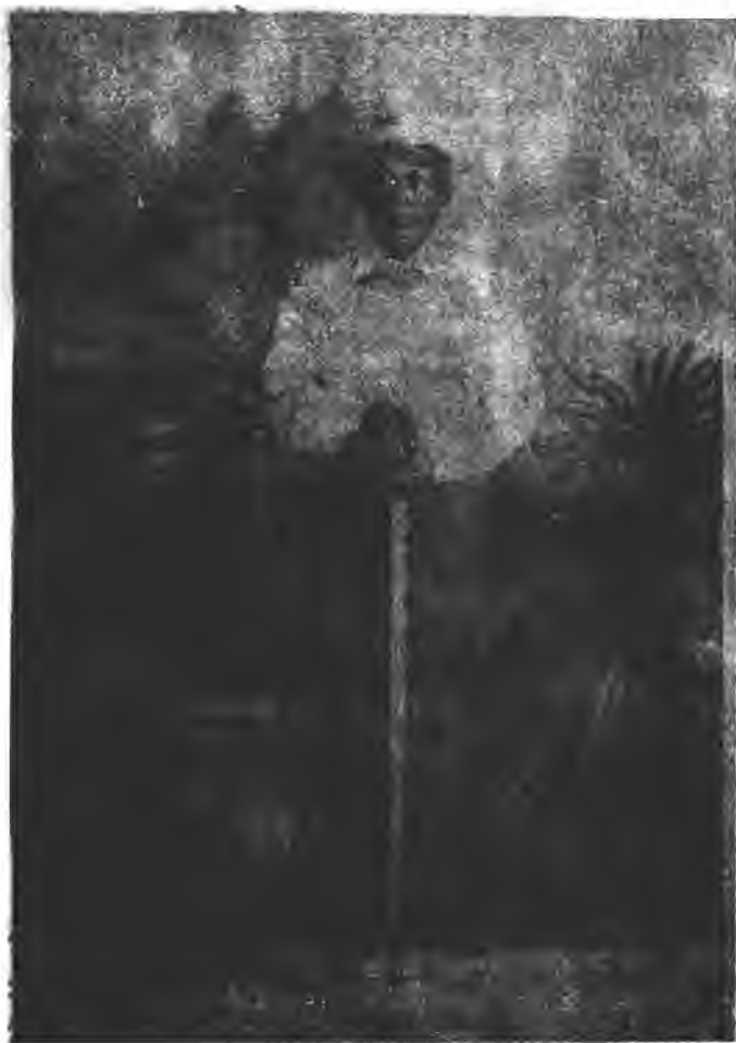
Victoriano Lorenzo, a los 33 años de edad.